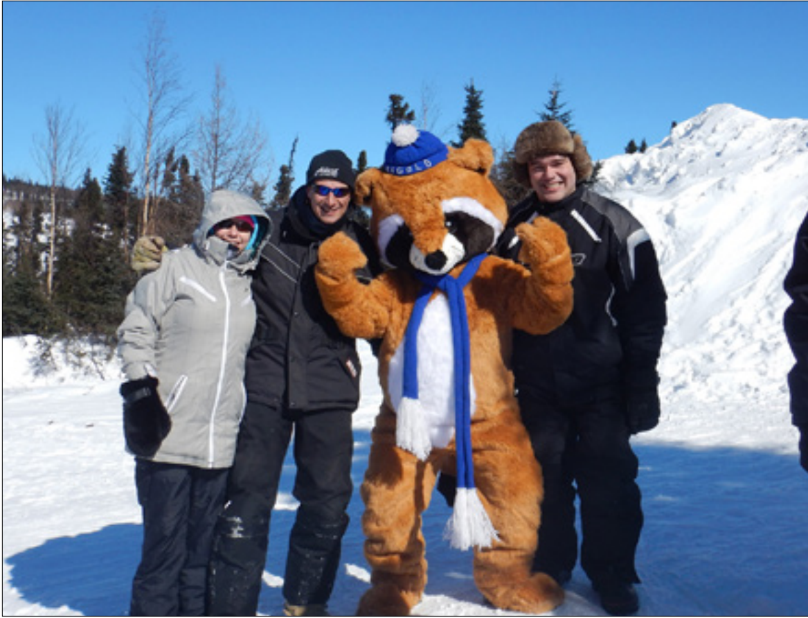
Si Rigolo, la mascotte des Jeux Franco-Labradoriens, maintient la tradition, elle sera de toutes les activités, comme ce fut le cas en 2015, année de cette séance de photo.

C'est en jouant dehors et à l'intérieur que les francophones de l'ouest du Labrador ouvriront le bal des célébrations des Rendez-vous de la francophonie 2019 dans la province. C'est en effet le 1 er mars que débutera la 35 e édition des Jeux franco-labradoriens dont les activités se dérouleront à Labrador City, à Wabush et à Fermont, au Québec.