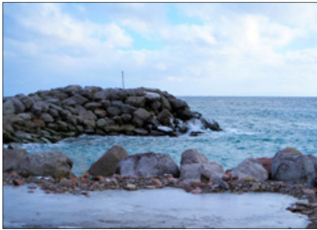
Oeuvre de Joseph Benoit, Cap-Saint-Georges / Entre la montagne et les falaises du boutte du cap, l'iridescence de l'île rouge, la route qui épouse le littoral, la péninsule hautement photogénique représente tout un terrain de jeu pour les apprentis photographes.